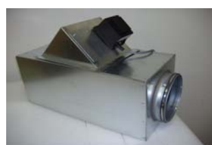
Monteringslåda med kanalpåslag