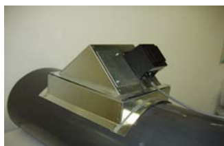
Montagedetalj för rundkanal med kanalpåslag